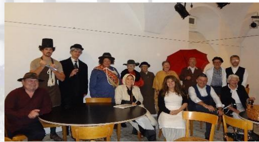
Impressionen vom Horgner Theaterspektakel 2020

Daten: 17.9., 18.9., 24.9., 25.9., 2.10. und 3.10.2021, jeweils 19 30 Uhr